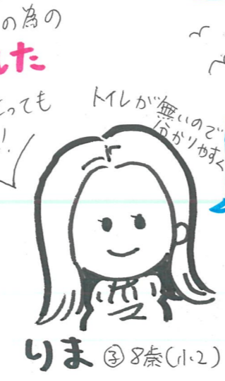
りま ③ 8歳(1.2)

子どものメニューが あるだけで嬉しい。 特別な食べものより、 特別な体験として。 取り分けづらい盛りつけも キッチンカーには多いので 工夫して頂けたら... (嬉)