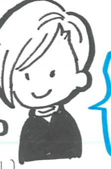
まろ ③ 16歳(高1)

仙台馬車から見えるけど、 特徴や向を向いていない 昔はパーセントもあってステキだった!