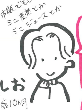
しお ③ 10ヶ月

子どものメニューが あるだけで嬉しい。 特別な食べものより、 特別な体験として。 取り分けづらい盛りつけも キッチンカーには多いので 工夫して頂けたら... (嬉)