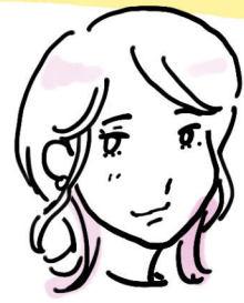
カフェイン SNSマーケティング 関係